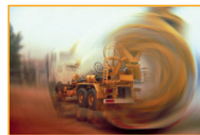
Beton dat klaar is om te gebruiken 11,2 miljoen m 3

Italcementi werd in 1864 opgericht maar is nu in de internationale wereld onvermijdelijk geworden met de aanpak van Ciments Français in 1992.